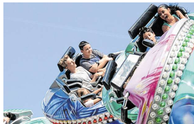
Nicht wenige Besucher erlebten bei dem Besuch der Kirmes ein wahres Hochgefühl.

schen Musikvereins einmal über die Kirmes. Am Franziskanerplatz wurde an der Geisterbahn ein Halt eingelegt, auf dem Kirmesplatz an