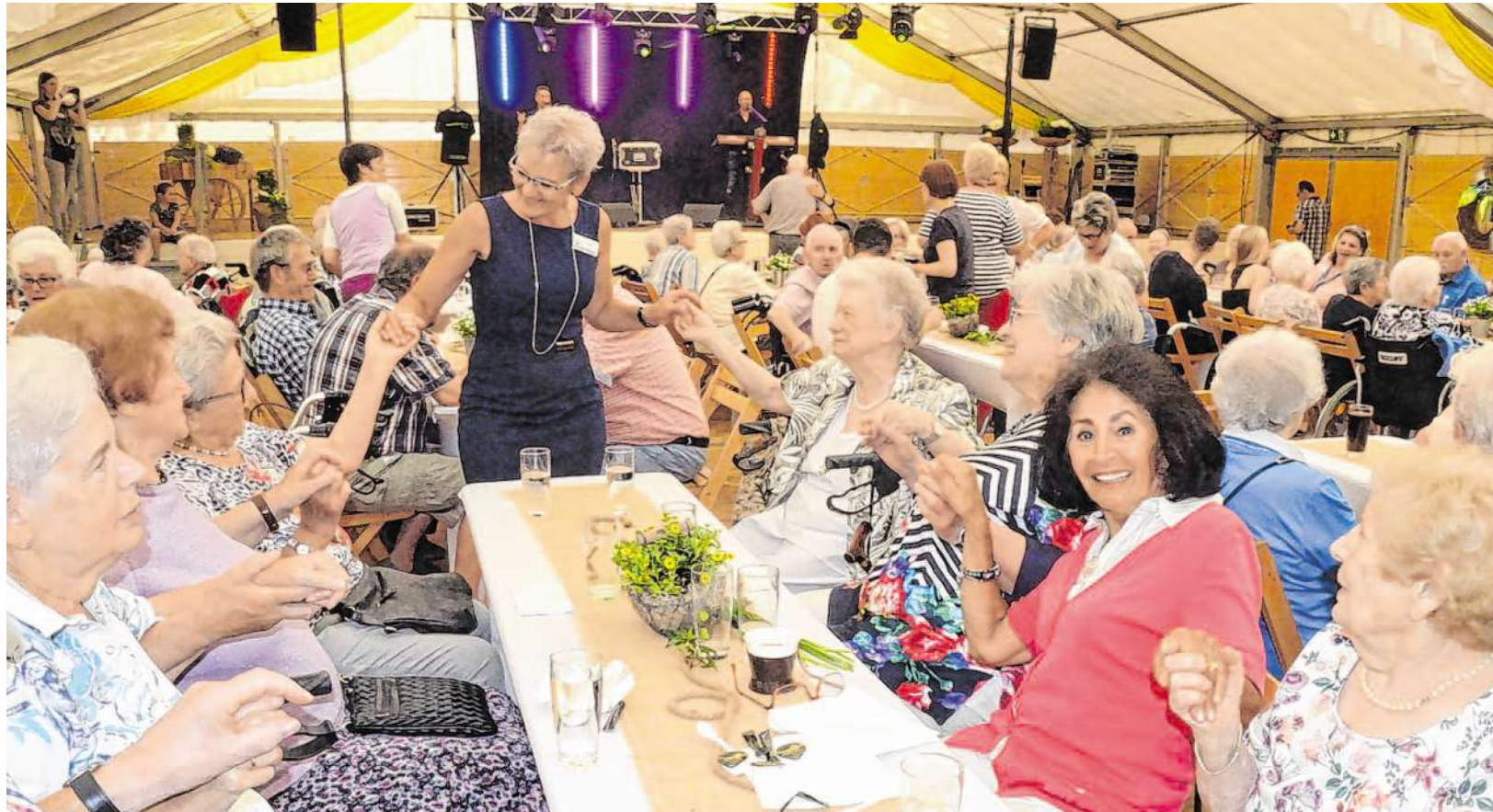
Es durfte geschunkelt werden im Festzelt: Der Schlagernachmittag stand unter dem Motto „Die Burg singt“.